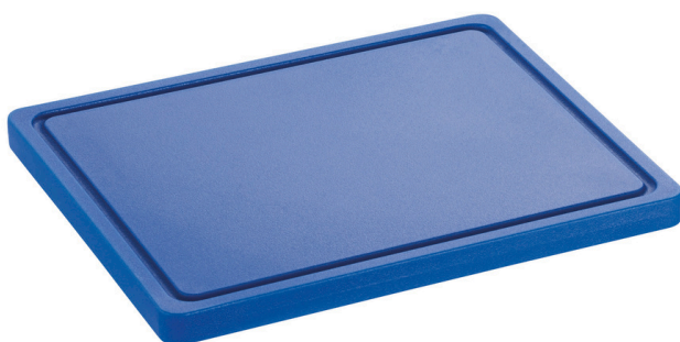
Planche à découper PRO 32x26 B-R