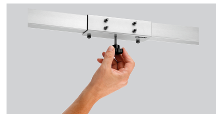
► Montage et démontage faciles