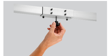
▶ Eenvoudige montage en demontage