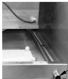
Трубка для отвода конденсационной воды