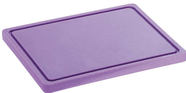
Planche à découper PRO 32x26 LI-R