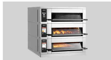
► Do instalacji i łączenia pieca piętrowego CL6080-3