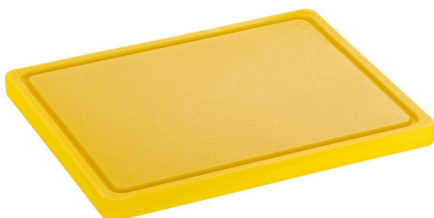
Planche à découper PRO 32x26 GE-R